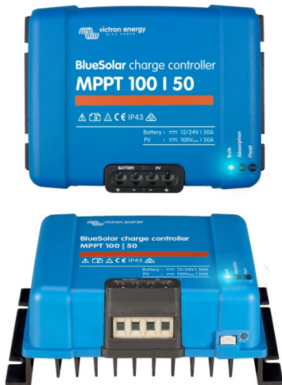
Solcellsladdningsregulator MPPT 100/50